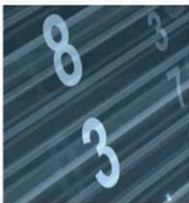
Tableau de bord économie n°1